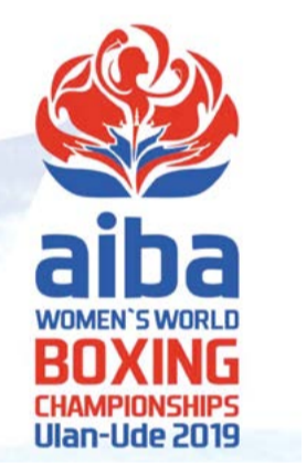
উলান উদে, ওক্টোবর ০৬ (এজেক্স): রসিয়াগী সিটি উলান উদেদা পাঙথোকপা বর্ল্ড বুমেস বোক্সিং চেম্পিয়নশিপকী কিলোগ্রাম ৬০গী