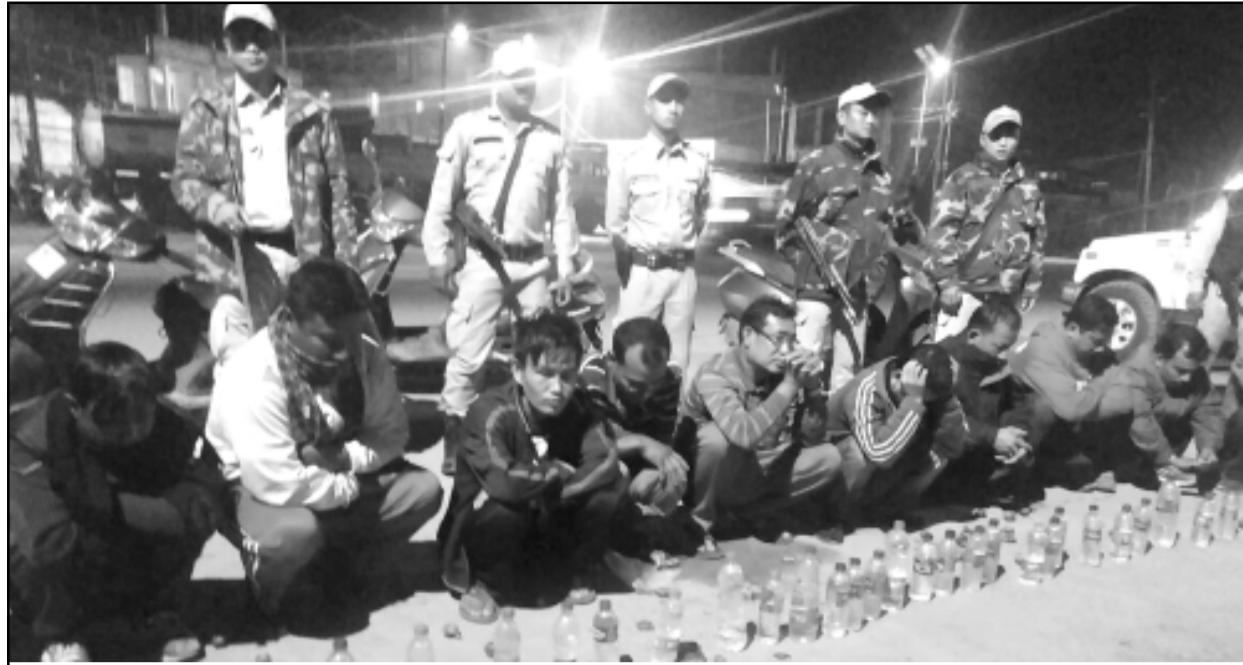
শঙাই ফেটিলেজী মাঙ ওইননা ইফালগী তোঙান তোঙানবা মফমদনী মণিপুৰ পুলিসনা ফাগলকথিবা যুঙৌ অমদি য়ু য়োনবশিং