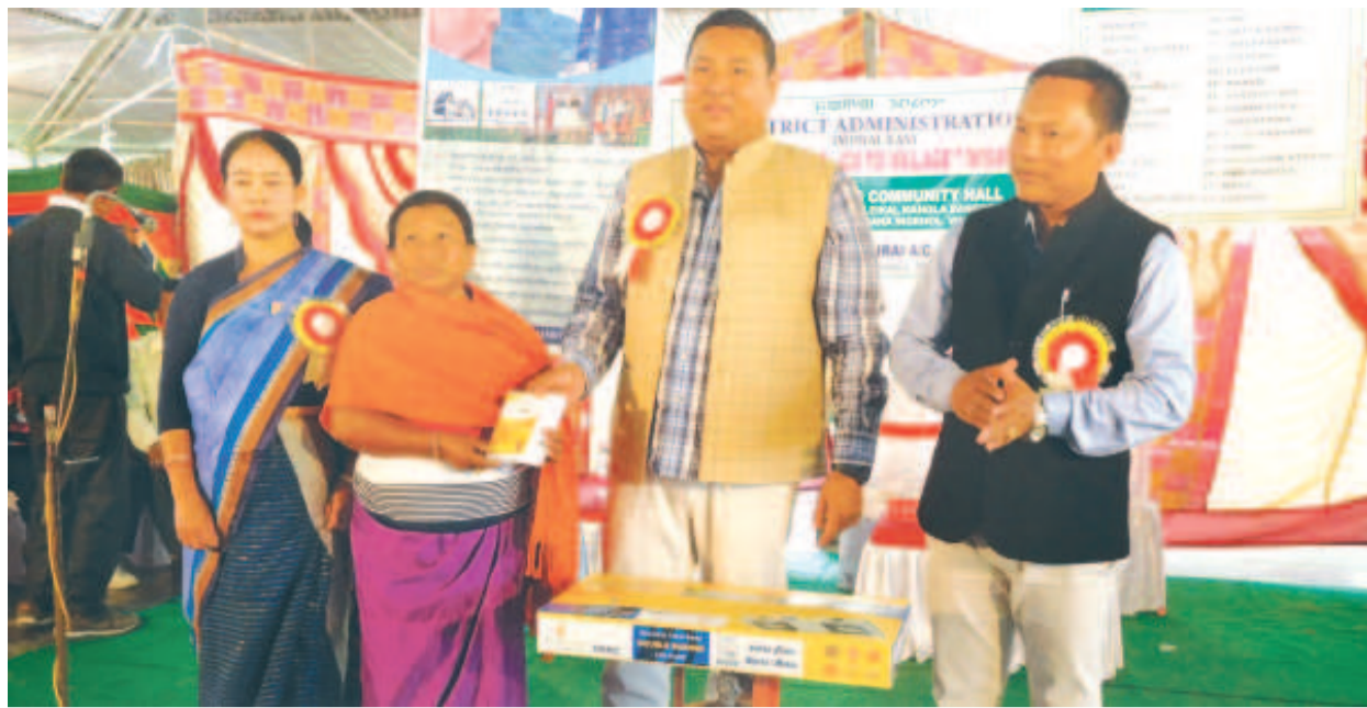
ইম্ফাল ইষ্ট দিষ্ট্ৰিক্ট এডমিনিষ্ট্ৰেশ্বন শীন্দুনা কংলা সঙ্গোমশঙ কমিউনিটি হোলদা পাঙথোকপা খুংং চংসি থৌরমদা খুয়াই এ সীপী এম এল এ সুসিদ্মনো শরক য়া

ট্রাণ্ডমেন্ট/খোঙ হান্না যাদবা, খোঙ হান্নগসু মতম কুইনা চংবা, অমাঙথোং মনুংদা পোহা অমদি অমাঙথোং ময়াদসু হুয়াই মঙ্গল মকমু চাউনা পোহগা লোবা, খোঙ হান্না মতমদা ৰাতিম মতেক্লুয়া পীক্কা থোক্কপা ফহনবগী ওজা জিয়া উল হকপু থাগংচরি