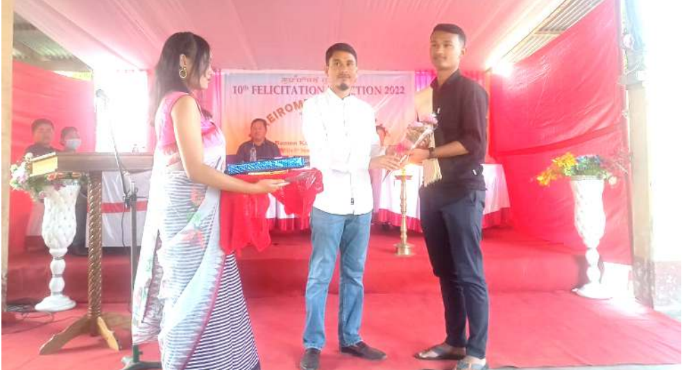
পুৱৈৱোৱা যুথ ৰুৱনা শিন্দুনা বমোন কম্পু ময়য় লৈকয়দা লৈবা ইবুৱৌ পুৱৈৱোৱা কমিউনিটি হোলদা পাণ্ডথোকখিবা অফবা মইৱোৱাশিংবু তৱায়া ওকপগী খৌৱম

লৈখিদবা লুমলাগী এম এল এ জাহ্নেগী মফমা ইকাইখুৰা উৎপা ওইনা ফেষ্টিবেল অসিগী মতম য়ৈথোকখিবনি। লৈখিদবা এম এল এ জাহ্নে ফেষ্টিবেল অসিগী পেগ্ৰোন ওইনা লৈৱননি। ফেষ্টিবেল অসি পাণ্ডথোক্কবা হোংনবদা লৈখিদবা এম এল এ অসিনা মৰুওইবা খৌদাংশিং লৌৱমখি হায়ৰি। পনবা য়াবদি হায়ৰিবা ফেষ্টিবেল অসিদা তৌৱন তৌৱনবা ষ্টেটিংদগী মীওই কয়না শৰুক য়াগদৌৱি।