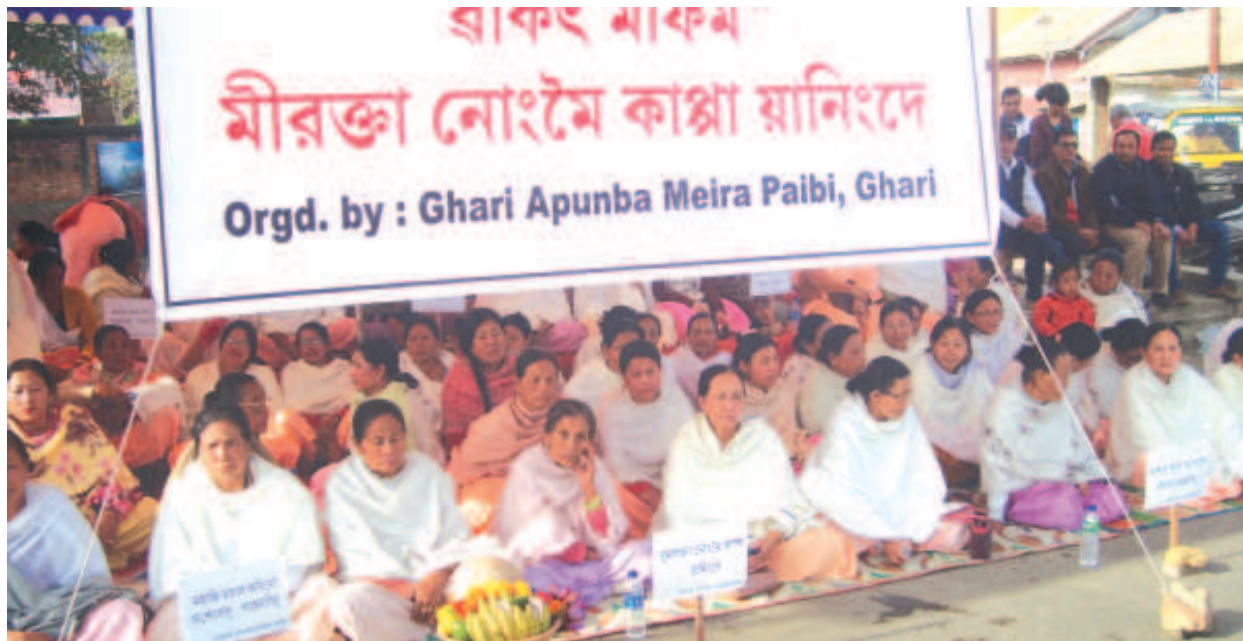
এম পি গিৰী জেনেৰেল সেক্ৰেটাৰি হাওবিজয় গিতাজেনগী মুমদা নোংমৈ কাপশিল্লগী মায়েজা ঘড়ি অপুনবা মৈরা পায়বীনা বাকং মীফম ফমখিবা

খোঙ হান্সা য়াদবা, খোঙ হান্সগুম মপুং ফানা হান্সা য়াদবা, অমাঙথোং ময়াদা পোমথোক্কা লেবা, অমাঙথোং মনুংদা য়ান্সা চিকপা নাবা, পুজা গ্যোষ্টিক কাবা, পুকচপ নাবা, মরক মরজা অমাঙথোং অকোয়বদা মরং মরং চপা ফহনবগী ওজা জিয়া উল হকপু থাগচরি