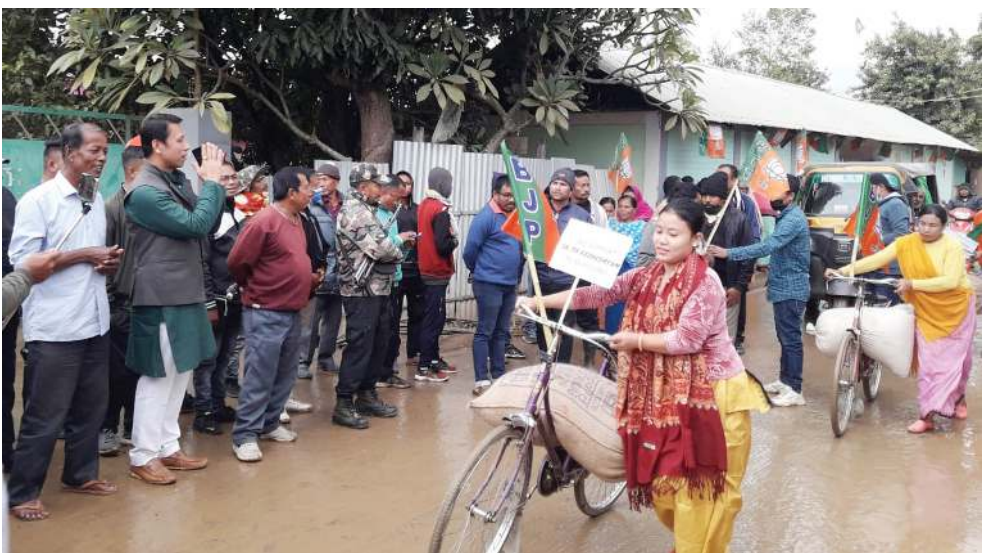
হেৰোক এ সীগী মনুং চেনবা তেজ্ঞন তেজ্ঞনবা শোখিংশিনা লৈবা মীওইকয়না এ সী অসিদগী এম এল এ টি টি ব্ৰাভেলরশিংগী অমদি কৌশিং মজে পীৰখিবা

টেঞ্জনিয়াদগী দেল্লীদা থুংলবা ভেজিন মপুং ফানা কাপ্ৰবা মশাগী চহী ৩৭ শুরবা নুপা অমা থাৰগা লৈবাক অসিদা ওমিক্রোনগী কেস ২১ শুখি।