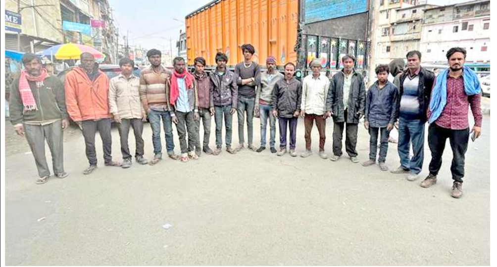
মতম হেল্লবা আই এল পি পায়ৱহুগীদমক সিটি পুলিসনা নাগামাপাল এৱিয়াডগী ফাগংখিবা নন লোকেশিং

পোংলমশিং অসি ফঙখিবগা লোয়ননা মহাক্কী মখা কেস অমা ৰেজিষ্টৰ তৌদনা লৌখংলে হায়রি।