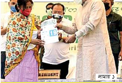
কংলাদা দিরেস্তোরেট ওফ ইনভাইরনমেন্ট এন্ড ক্লাইমেট চেঞ্জনা শীন্দুনা কংলাদা পাণ্ডথোকপা যৌরমদা চাফ মিনিষ্টর এন বিরেননা বেনিফিসরি ৬৫দা ঙ-ওটো অমসুং ঙ-রিক্সো য়েছোকপা