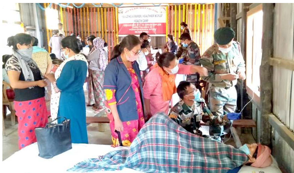
অহল ওইৰবা মীওইশিংবু মশা মউ ফনা লৈহয়বগী পাদমদা ২২ সেপ্টেম্বৰ অসাম ৰাইফলসকী মীংয়েং মখাদা ৪৪ অসাম ৰাইফলসনা শীপুনা তমংলোং দিষ্ট্ৰিক্টকী মনুং চনবা দাইলোং ভিলেজতা পাণ্ডথোকখিবা লোমা লায়েংবা খৌৱমগী মমিং অমা

হায়না লেটাৰ অমদা ইয়ে। কোৱাৰাণ্টাইন ইনফেক্সন মথা শান্দাৰকপা থিংনবা ত্ৰিপুৱা গভৰ্ণমেণ্টনা অনৌবা গাইদলাইনশিং ইশ্বা তৌখিবা মতুংদা পাণ্ডথোকপা টেষ্টতা সী এম দেব কোভিড-১৯ পোজিটিভ ওইৰহয়নি।