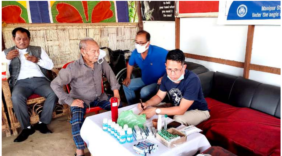
মণিপুৰ ষ্টেট লিগেল সৰ্ভিসেস ওখোৱিটনা শিন্দুনা পাঙথোকখিবা নোংমগী ওইবা মেডিকো-লিগেল হেল্প কেম্পতা অহলিং লেমা লায়ংখিবা

লৌখিলাবা হোংনদুনা লাক্ষি অদুৰ হৌজিক ফাওবা মসিগী ৱাৱেইশিন অমা পুৰুৱা গুমেত্ৰিৰিৰি নাগা মীয়ামগী অশোয়বা খৰা লৈবদগীনি। নাগাগী ওইনা লৈৱিবা মায়াদবা গুপশিংনা তোঙান তোঙানবা দিমাং দশিং তৌৱনা মৱম ওইৱগা গুসি ফাওবদা নাগা পোলিটিকেল ইস্যু লৌখিলাবা গুমেত্ৰিৰিৰি নাগা পুৰুৱা গুমেত্ৰিৰিৰি হায়খি।