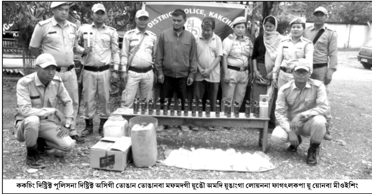
ককচিং দিষ্টিক্ত পুলিসনা দিষ্টিক্ত অসিগী তোঙান তোঙানবা মফমদগী য়ুত্তৌ অমদি য়ুঙঙাংগা লোয়ননা ফাগলংকপা য়ু য়োনবা মীওইশিং

ট্রাফিক/পুকনুশিং কাবা, খোঙ হায়া চাং নাইদবা, খাঙ নাবা, খোঙ হায়া খুদিংগী শৌজ নাহুবা, ফিটুলাদা মখল হুংলগা নাই চারকপা, চাকখাউ শোকপা, খজিন শৌগৎপা, অমাঙথোংদা মরেং মরেং চংলগা য়ায়া হাকুংচবা, খোঙ হায়া মনাংগা লোয়নরকপা, পুক নাবা, য়েকপা থিনবা তৌরগা খোঙ হায়া হামিং তৌরগা লৈরবা ফহনবগী ওজা জিয়া উল হগ-পু থাগৎচরি