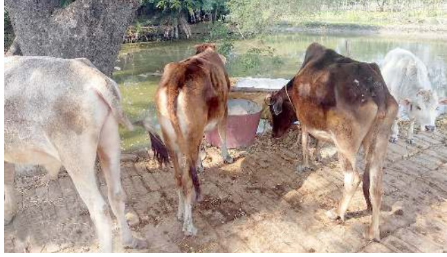
ঐখোয়গী মীংনা উবা ফংদবা গাণী মচিঞ্জাক ওইরিবা প্ল্যাস্টিফাইং মশীং যামহনবদা