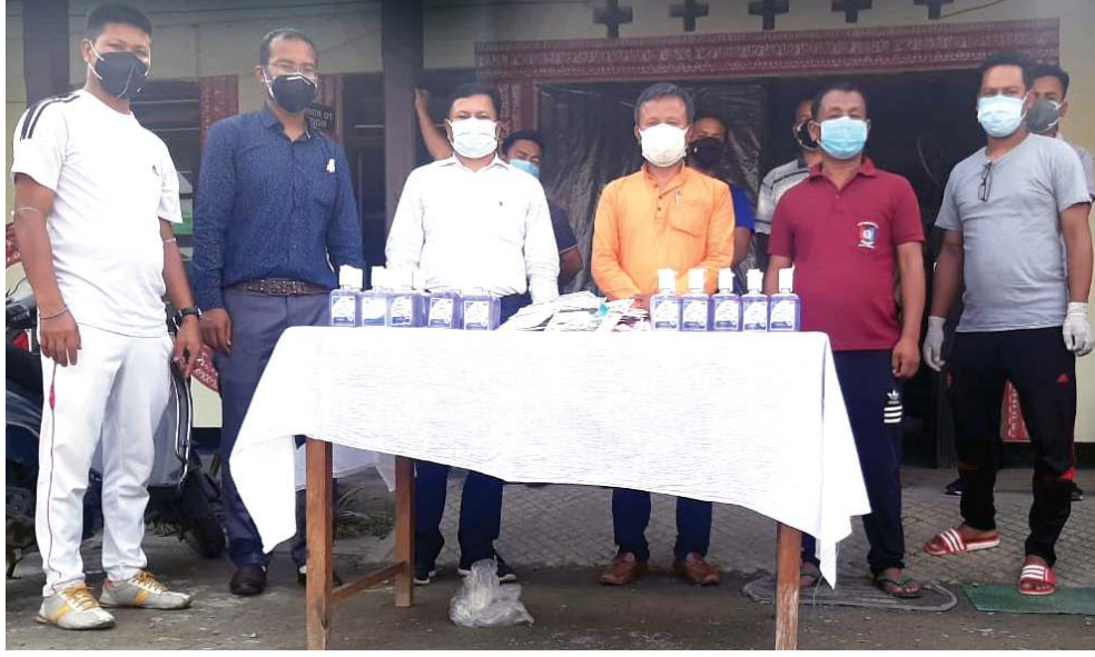
বি জে পি মণিপুর প্রদেশকী ডি পি এন নিহসকী মীংয়েং মখাদা শামুৱৌদা লৈবা হেষ্ঠ এন্ড ৰেলনেস সেক্সুৱা হেদ সেনিটাইজৰ অমসুং এন-৯ ৫ মাষ্ট ৱেহোকবিবা

হৌখিবা নোংমাইজিং নুমিতসু ইন্দিয়ানী মেটরোলজিকেল দিপাৰ্টমেন্টনা লৈবাক অসিগী অৱাং নোংপোক থংবা শৰুত্ৰা লৈরিবা ষ্টেটশিংদা অকনবা নোং চুৱাৰা যাই হায়না ফোণ্ডদোকবিগা লৈশ্ৰে। মনুগী মতুং ওসি অমুক হমা দিপাৰ্টমেন্ট অসিদা অসাম অমসুং মেঘলয়াদা জুন ৭ তা অকনবা নোং চুৱাৰা যাই হায়না ফোণ্ডদোকবিগা লৈশ্ৰে।