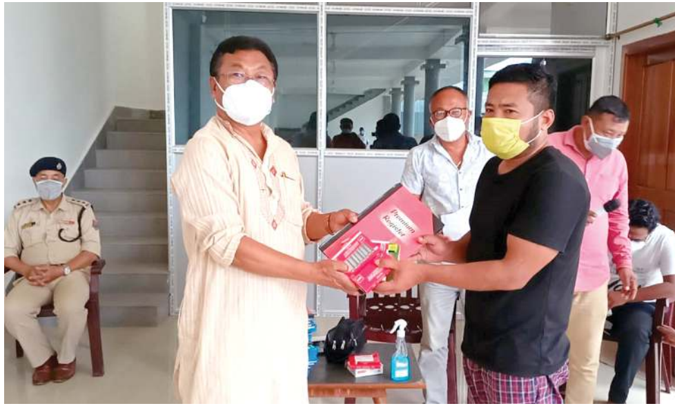
হিয়াংলম এ সীগী এম এল এ ডা. ৰাই ৰাথেশ্যামনা লাংমৈদোংদা লৈবা যুম অমদা পাঙথোকখিবা মীফম অমগা মৰী লেননা এ সী অদুদা লৈবা কোভিড টাক্স ফোসশিংদা মখোয়না থবক তোবদা শীজিগনবা শেল, ৰেজিষ্টৰ, কলম, মাফ্ৰ অমদি সেনিটাইজৰনাচিবা পোংলমশিং য়েহোকখিবা

অগৰাটলা, জুলাই ০৭ (এজেন্সী): ত্ৰিপুৱা লৈরিবা জনেলিষ্টিং অমদি মখোয়গী ইমুং মনুংগী য়াইফ খোৱাংগা মৰী লেননা ত্ৰিপুৱা কেবিনেটমা ত্ৰিপুৱা জনেলিষ্ট সনমান পেপন স্কিম ২০২১ অমসুং জনেলিষ্ট পৰিবাৰ সুরকসা স্কিম ২০২১ এফ্ৰড তোখে হায়রি।