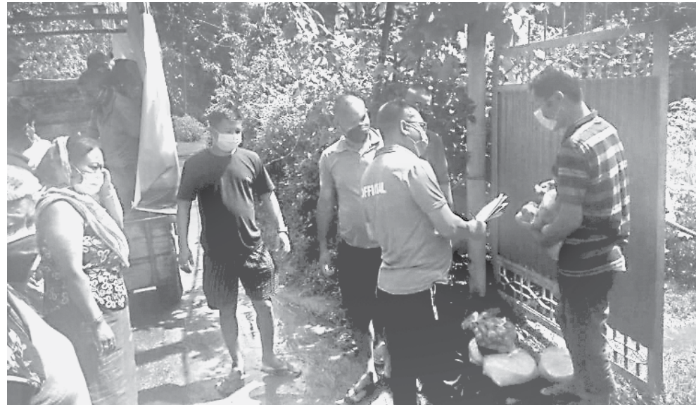
পাংসোয় এ সীগী হায়গী এম এল এ সাপম কুঞ্জিকশোৱ (কেবা)গী মীংয়েং মখাদা হৌজিক কোভিড-১৯ পেদমিকনা চেংথেং নংহুৱা এ সী অসিগী মনুং চ্চা লৈবা শাগোলবন্দ টোৱা লৌখাম লৈৱক অমদি তাকয়েল কোলোম লৈকায়দা লৈবা যুম লীশিং অমরোমদা চানবা পাংলমশিং য়েহৌকখিবা

গুৱাহাটী, গুৱাটী ০৭ (এজেন্সী): হৌখিবা পুং ২৪গী মনুংদা অসম ষ্টেট কোভিড-১৯গী অনৌবা কেস ৯৮৬ থেংনশিবা লায়ননা হায়রিবা মতম অসিদা লায়না লাইচং অসিনা মতম ওইৱগা মীওই ১৫ শিখনখি হায়না অসাম হেল্থ ডিপাৰ্টমেন্টনা ফোণ্ডেৰেক্সি।