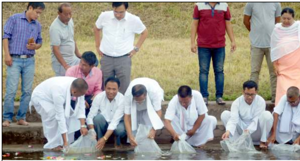
ফুজিইন কামিটি মণিপুর (যু সী এম) না শিদ্দনা অধিবিশিষ্টী খুম ওইরিবা কেফুপাংতা লাংবন হৈশোই তফ্ফা লোয়ননা ডা মচা খাদবা