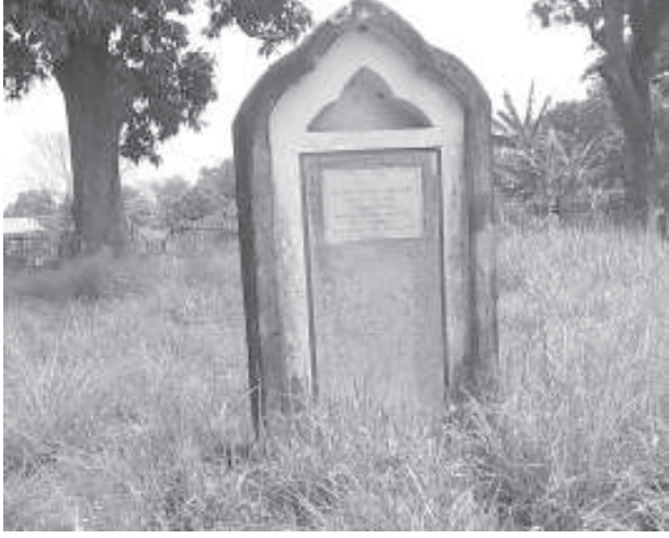
য়াওৰিবা মরু ওইবশিংদি :

য়ান্মা মরু ওইবা ব্ৰাহ্মজিনস পেরিওড হয়বদি ১৫/৮/১৯৪৭ - ১৫/১০/১৯৪৯ মতমদা সার অকবর হায়দরিনা শিলোংদা বেজ তৌদুনা মণিপুৰগী গভৰ্ণৰ ওইবশ্ৰমী। মহাক্লা মণিপুৰগী মহাৰাজ বোধ চন্দ্ৰগা য়ান্মা ফজনা অন্দৰষ্টেণ্ডিং লেনৰশ্ৰমী। মহাক্লা মণিপুৰৰ য়ান্মা পামজবা অমদি নুংশিঙবা ওইবদা ছুটিশিং য়াওনা, মণিপুৰদা য়ান্মা তৌইনা তৌইনা লাঙ্কশ্ৰমী। কুমজা ১৯৪৯গী অঙনবা নিংখমথাগী শৰুকতা রাইথেই ইন্সপেক্সন বঙ্গলোদা ছুটিদা গুনু কাপ্লা চংপা থৌদোকুদা হাট এটেক তৌদুনা লৈখিববদি মণিপুৰগীমজ্ঞতা য়ান্মা লাইবক থীবনি। লেদি হায়দরিনা পামজবা মতুং ইয়া মহাক্লা মশা অদু কংলা ফোটতা ফুমখি অমদি মদু হৌজিক ফাওবা উবা ফংলি। (ফোটোদা উৎলিবা)