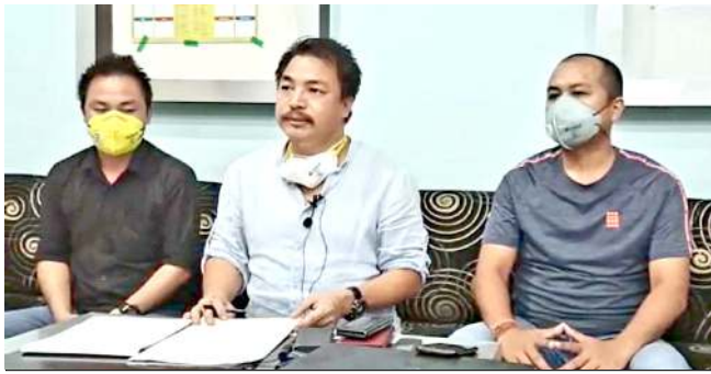
ইটনগাৰ, সেপ্তেম্বৰ ০৭ (এজেলি):

চাইনাগী পিপলস লিবৰেচন আৰ্মি (পি এল এ)না ফাখিবা মীওই ৫ অশোয়-অভ্ৰাম য়াওদনা থাদোকহন্নবা য়ৌৱাং লৌখংকদবনি হায়না ওল অকনাচল প্ৰদেশ ষ্টুডেন্টস যুনিয়ন (এ এ পি এস যু) না তকশিনত্ৰে।