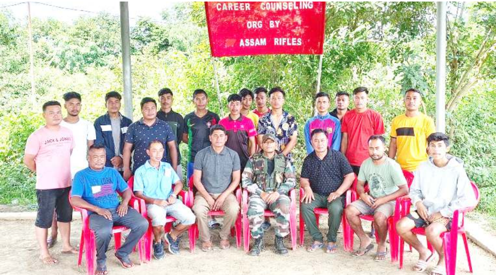
আই জি এ আর (সাইফ) কী মীংয়েং মখাদা ফুন্সে বটিলিয়ন অসাম ৱাইফলসনা শিন্দুনা ককচি দিষ্টিক্তকী মনুং চনবা মরিংবাল ভিলেজদা কেৱিৱর কাউন্সিলিং পাঙথোকখিবা