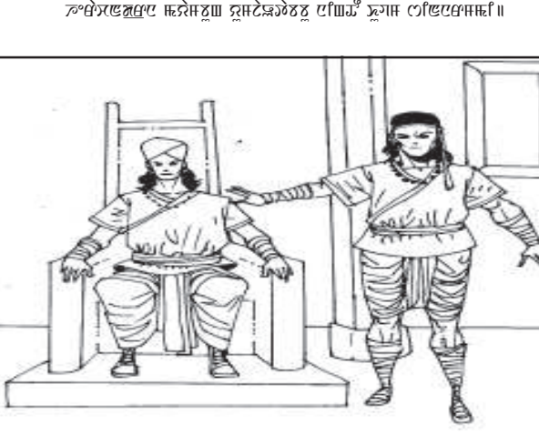
ৱাৱী জয়সুং থুৱেক - সমসন সলাম

হেৱাচন্দ্রনা ময়াসুং য়ুমজাওতাববু নিংখৌ খুডম শিল্লৱশী।