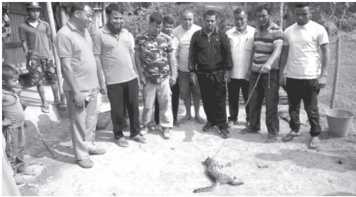
রাইল্ডলাইফ অপ বার্দেনে যৌবালগী দল্লি়য়ু রামেশচন্দ্র অমসুং ককচিং রেঞ্জ ওফিসকী ঠাফনা শোৱাদগী কৈজেংলাং অমা কনখিবনী শক্তম

ট্রাফিক/অমাংথোং মনুংদা চাথংলগা য়ায়া থুঙা অমদি শাবা, অমাংথোং ময়াদা পোমথোঙগা লৈবা, খোঙ হান্না খুদিংগী ঙৈ দ্রোপ দ্রোপ তারকপা, খোঙ হান্না য়াদবা অমদি খোঙ হান্না মপুং ফানা হান্না য়াদবা, পুজা গ্যাষ্টিক কাৱগা য়ারোমদা খেগংপা ফহনবনী ওজা জিয়া উল হগপু থাগৎচরি