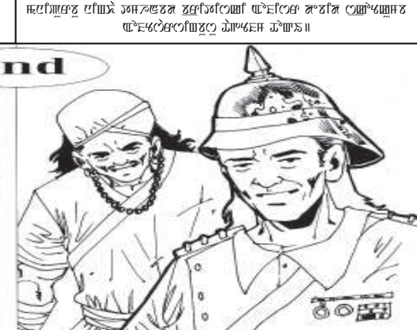
ৱাৱী জয়সুং থুৱেক - সমসন সলাম

মণিপৰবু নিংখা তমহনবদা বৃশচিক ওফিসৱ দেবিড ষ্টোচকুৱা ওফিসৱাশিংবুসু থাগংফম থোকই।