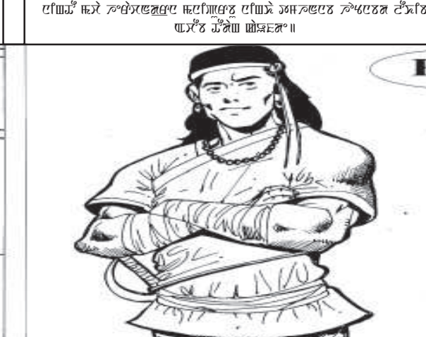
ৱাৱী জয়সুং থুৱেক - সমসন সলাম

নিংখৌ মচা হেৱাচন্দ্রনা মণিপৰবু নিংখা তমহনবা হোংনবদা লৌথিবা অচৌবা যৌনা কাওফদে।