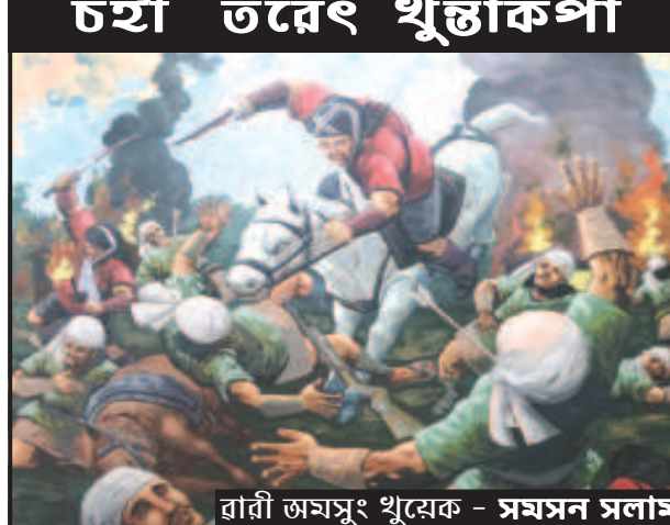
ৱাৱী জয়সুং থুৱেক - সমসন সলাম

হেৱাচন্দ্রনা ময়াসুং য়ুমজাওতাববু নিংখৌ খুডম শিল্লৱশী।