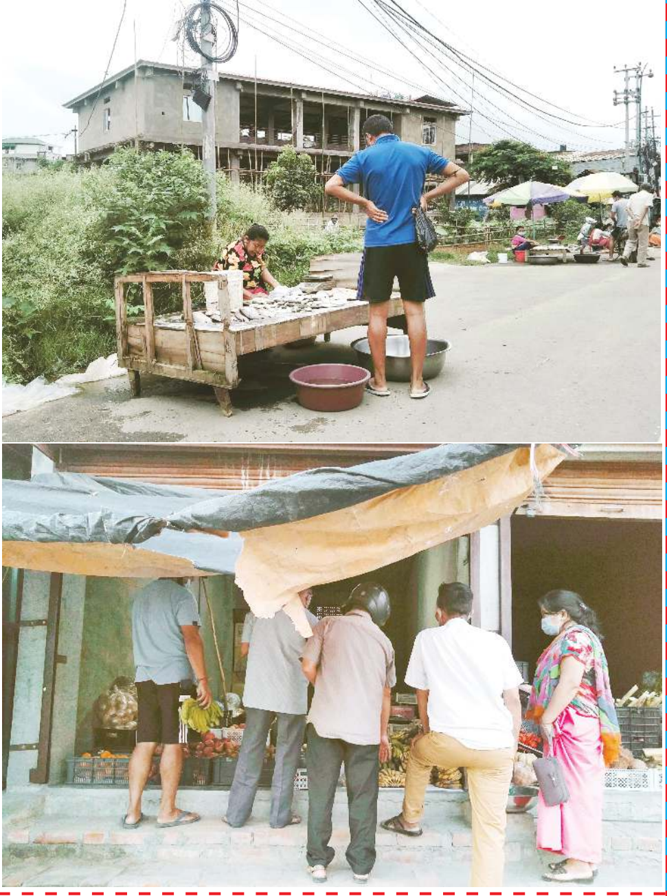
ফ্ৰমুং মথঙা ৬ মৌল্লি, ওশংবা নাফেই লৌশিং শংখ্ৰা বোৱা মনুংদা মোমশিল্পী মুম্বা য়েংখৈ। নাফেই ওশংবা ওশংবগা ৩০নংবগা ৩০নংবগা হেমা হাওগনি, চাদবদি মাদ। ৮৬ মী ৰৌৱাৰি লাইগী শোয়দনবা। মীগা লাইগা ফনাবা হেমা মৰুওই, ৬ নংবগা নাফেই, ৮৬ নংবগা হেমা, ঈশিং নংবগা নুংশিং।