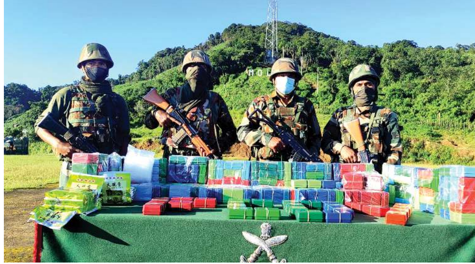
চাদেল সিপ্তিকী মনুং চনবা ইন্দো-মান্দার গুমেখৌ শরুজা চাদেল বাগলিয়ন অসাম রাইফলসনা চখিবা থি ছফী থবজা হিরোইন কেজি ৫.২ ফাগথিবা

Sd/- Sub-Deputy Collector, Imphal West, Hiyangthang