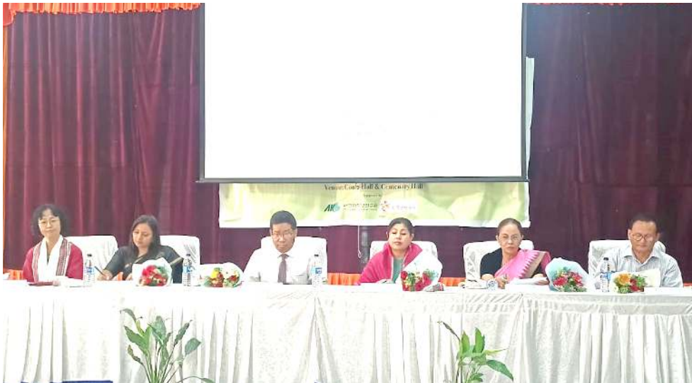
দিপাটমেন্ট ওফ কোৱিয়ান লেংগুয়েজ, মণিপুর যুনিভাৰ্চিটীনা শিন্দুনা ডি সী কোর্ট হোলদা পাঙথোকখিবা হুহুগী দেৱী যৌৱমদা দাইজ মেম্বৰ ওইখিৱশিং

এন এফ আরনা মখা তানা ফোঙদোকখিবদা, নোথ ইস্ট ফ্রন্টিয়ারনা কোনবা ৱেলৱে ষ্টেসনশিংদা ৱেলৱে প্রোটেক্সন ফোর্সশিংদা চাং নাইনা হ্যামেন ট্ৰাফিকিংগী মায়েক্তা ওপৱেসন কমা চখাদুনা লাক্কি। মখা তানসু চখাখিগনি। ষ্টেসন মনাক নক্সা লৈরিবা বীওইশিংনসু চিনবা লৈৱবদি খুদক্তা ষ্টেসনদা মখৌ তৌরিবা আর পি এফতা পাউ দীৱিয়ু। মসিনা চহী নৌরিবা অঙাংশিং অৱানবা লম্বীদা চখিগদবদকী কনবা ঙমগনি হায়রি।