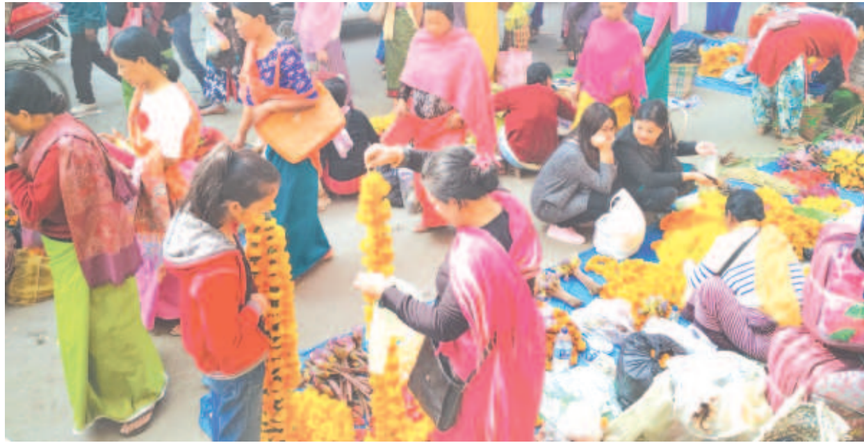
দিবালি কুশ্লেগা মৰী লৈননা ঋতুইয়ৰদ কৈথেলাদা তোঙান-তোঙানবা মফমদী লাকপা মীওইশংনা লাইদা কনবা লৈ লৈনবগী শক্তম

টোপাৰোপ/খোঙ হান্না খুদিগী শৌজ নাহুবা, খোঙ হান্না লোয়ৰগা মশানা অমুক হনগংখিবা, অমাঙথোং মনুন্দা চাখংপা, খোঙ হান্না অকনবা ওইনা হান্নগা চাখংপা অদুনা খেংলগা য়ান্না নাবা, অমাঙথোং ময়াদা পোমথোকপা ফহনবগী ওজা জিয়া উল হকপু থাগৎচরি