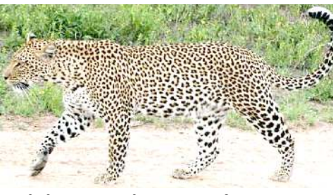
গুরাহতি, দিসেম্বর ০৭ (এজেলি):

অসম এঞ্জিনিয়ারিং কলেজ (এ ঈ সী) গী মইরোয় অমা ইরাই নুমিংগী নুমিত্তা মপুং মইরোয় ফাওবা কবোকৈ অনীনা এটেক তৌয়ে।