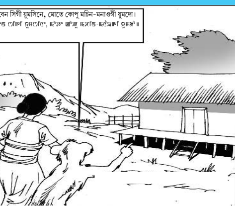
ইবেন সিগী যুমাসিনে, মোটে কোপু মসিন-মনাগী যুমসো। ঞাংগাং ঞাংগাং ঞাংগাং ঞাংগাং ঞাংগাং