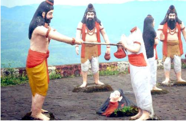
ইতানগর, দিসেম্বর ০৭ (এজেলি):

অফনাচল প্রদেশকী দেপুটি চীফ মিনিষ্টর চৌনা ম্যোনা লোইং দিল্লিক্কী এদমিনিস্ট্রেশন অমসুং অটে স্টেকহোল্ডরশিংদা পসুরাম কুন্দ মেলা ২০২০ অনৌবা মশক অমা