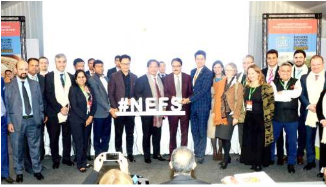
শিল্লোং, দিসেম্বর ০৭ (এজেলি):

নোর্থ ইষ্ট ফুদ সো সী নুমিং হুইয়াং ওইবা অহানবা ঈদিসন ইরাই নুমিত্তা শিল্লোংদা চীফ মিনিষ্টরশিংগী কনক্লেভ অমা পাঙথোক্লেদনা লোইশিনখ্রে।