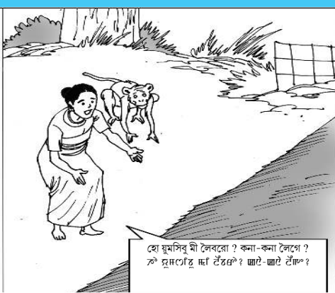
হোয়মসিবু মী লেবরো? কনা-কনা লেগে? ঞাংগাং ঞাংগাং ঞাংগাং ঞাংগাং ঞাংগাং

Central Industrial Security Force (CISF) Recruitment 2019. Central Industrial Security Force (CISF) invites online Applications for filling up the 300 Head Constable (GD) Vacancies.