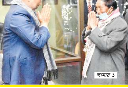
পাওয়ি (পেহ) ভিলেজদা থারদ্রা পোপী পান্ডিগাং খুঞ্জাশিংনা...