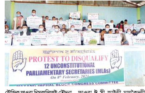
হৌজিক ফাওবা দিসকালিফাই তৌদনা লৈৱি। কোংগ্ৰেস পাৰ্লামিটী ই সী আইহা হীৱসিগা মৰী লৈননা মতিক চাবা...