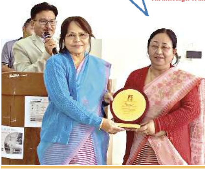
জি পি রিসেস কোলেজগী প্রিন্সিপাল ওইইই হিজম রোমি অমদি মেথমেট্রিক্স দিপার্টমেন্টকী হেদ ওইইই এন নিরমলাবু অচনা খুদোল তমদুনা কায়ন-থোরম পাঙথোকপা