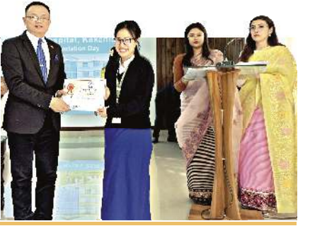
ককচীংগী জিবন হোস্পিটালনা চহী ১৪ মপুং ফারকপগী কুমওন থোরমদা লায়ংশঙ অসিগী খাইদগী ফবা ডাক্তর অমদি নসশিংদা শকখঙচে পীদুনা ইকায়খুম্খিবা