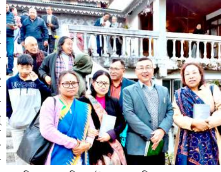
অনৌবা লোশাং তল্লনি। উচেক ৰায়া কয়াদী পোথাকফমসু ওইৱনি। লেইথি থিবদা ভাওজৰিবা খোইমু, খোইৱেন, হয়িংখোই কয়াদি পেঞ্জনি ইছোল অসি যৌৱকপদা...