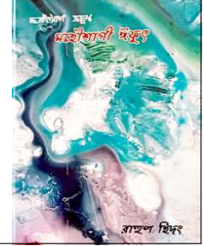
অচোংপা থাজবদনি নহা অইবা ৰাছল হিদংগী লাইৰিক অসিগী মিংখোল ওইৱিবা ফজৰবা শৈৱেং অসিদা ফোঙদোক্ৰিবলিবসু।