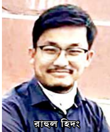
লাইৰিক মিমিং :- মহৌশাগী ঈফুং অইবা :- ৰাছল হিদং অফোংবা :- সাহিত্য খোংপা লুপ (শাখোঁলুপ) লাইৰিক মখল :- শৈৱেং লাইৰিক মখুম :- তোত্ৰম অমৰজিৎ লমায় মশীং :- ২১৮ (মৈত ময়েক ৱাওৱগা) মমল :- লুপা ৩০০/-

অচোংপা থাজবদনি নহা অইবা ৰাছল হিদংগী লাইৰিক অসিগী মিংখোল ওইৱিবা ফজৰবা শৈৱেং অসিদা ফোঙদোক্ৰিবলিবসু।