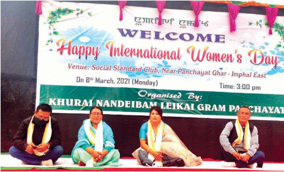
নান্দেইবাম লৈকাই গ্ৰাম পঞ্চায়তৰ শীৰ্ষকত 'হাপি ইণ্টাৰনেছনেল ৱ'মেনছ' দিৱসৰ প্ৰতি প্ৰাৰ্থনা কৰাৰ সময়ত অতিথীসকলক সন্মান কৰা হৈছে।