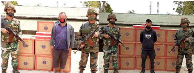
আইজেল, মাৰ্চ ০৮ (এঞ্জেলি):

মিজোৱাম অসাম ৱাইফলসনা ব্ৰগকী মায়োক্তা চণ্ডিকল্পকপা খোঙজংখিংগী মনুং চ্চা ষ্টেট অদুনা লোনা যাদৱা মওন্দা মপান লৈকাই পুশিল্লকখিবা লুপা লাফ ৫২ ৰোমগী ওইগদবা চুৰুটশিং ফাগংপা গুমেত্ৰ হায়ৱ।