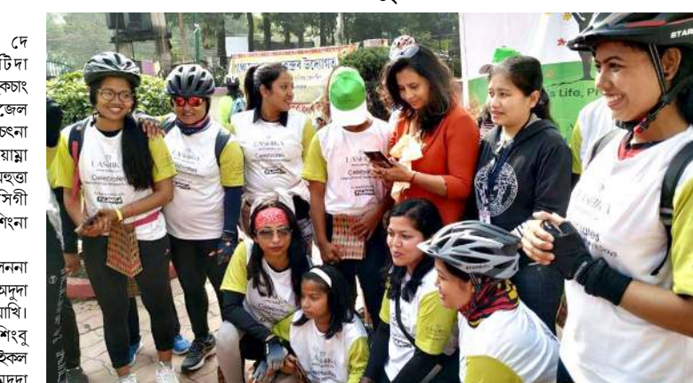
ৱিমেস দে খৌৱমদা মৰী লৈনা গুসি চংখিবা সাইকল ৱেল্লি অদুনা মশীং য়ালা নুপী কয়া শৰক য়াখি।

ইন্ডাৰনেমেলে ৱিমেস দে ২০২১ লাকপদা গুৱাহাটীদা নুপীশিংনা সাইকল খৌদুনা হকচাং ফনা লৈহনবা মীয়ামদা পাউজেল পীখি। কোভিড-১৯ লায়না লায়চনা চৈখেং পীৰিঙে মৰকসিদা মীয়াম ইঞ্জিন পানবা গাউ শীজিবগী মতুং সাইকল খৌদুনা চংনবা গুসিগী খৌৱমদা শৰক য়াখিবা নুপীশিংনা আপীল তৌৱকি।