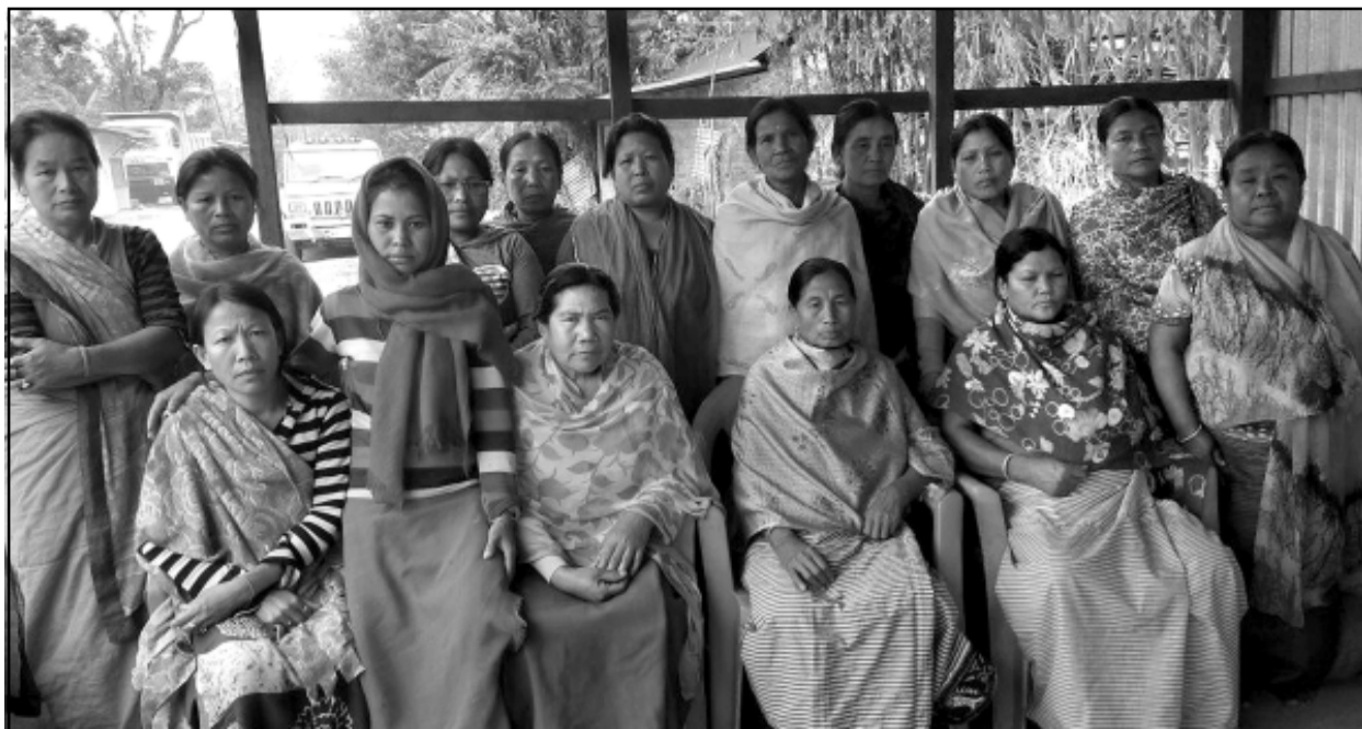
মণিপুরদা ময়াই কাবা চিঞ্জাক মফ ফননা মুখংনবা চঙশিল্পকপা খোঙজংগী শরুক অমা ওইনা কাদা ময়াং লাংজিং তনিংগী যুনিট হাংদোকপগী মীফম