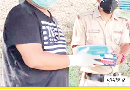
খৌবাল কৈথেলা লেবা ইতিন কম্পিউটাৰ আই টেকনিং অমসুং আই কোর সেন্টরনা ব্রুন্টলাইদা মথৌ তৌবিশিংনা মাঙ্ক, হেপ সেনিটাইজরনচিংবামিং য়াওনা চান-থক্কা পোংলমশিং য়েহোকখিবা