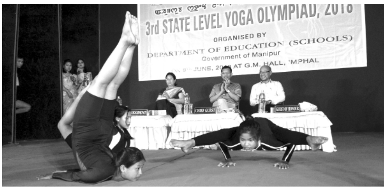
মণিপুর লেজেন্ডারী দিপাটমেন্ট ওফ এডুকেশন (স্কুলস)না শীন্দুনা জি এম হোলদা পাঙথোকখিবা অহসুবা স্টেট লেভেল যোগ ওলিম্পিয়দ ২০১৮

টোপাংমোং/খোঙ তোয়না হান্না, খোঙ হান্না অমাঙথোংগী অকোয়বদু চাউথোরকপা, অমাঙথোং ময়াদা মচা মচা অনী পোমথোকপা লৈবা, পুকনুশিং কাবা, খোঙ তোয়না হান্না, খোঙ হান্না মতমদা অকনবা ওইনা হান্না অমাঙথোংদা চাখ্লেগা খোঙ হান্না খুদিংগী ঈ দ্রোপ দ্রোপ তারকপা ফহনবগী ওজা জিয়া উল হগ-পু থাগৎচরি