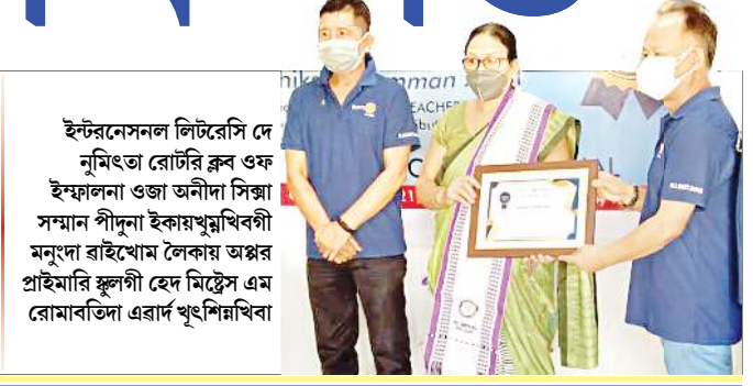
ইন্টরনেসনল লিটরেসি দে নুমিত্তা রোটরি ক্লব ওফ ইম্ফালনা ওজা অনীদা সিন্ধা সন্মান পীদুনা ইকায়খুম্বেখিবা মনুংদা রাইখোম লেকায় অঙ্গর প্রাইমারি স্কুলগী হেদ মিস্টেস এম রোমাবততা এরাব খুংশিমখিবা