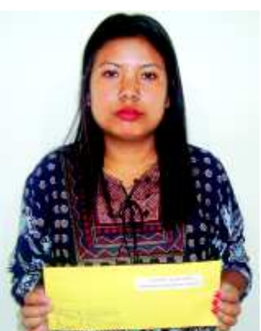
হুইয়েন লানপাউ লিটরেটরি কুইজ নম্বর ৫৭ কী রিগ্নর ওইব্রবী সগোলশেম লক্কাইবী চনু