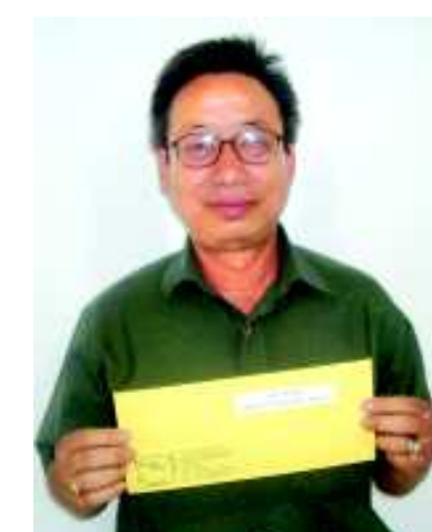
হুইয়েন লানপাউ স্পোর্টস কুইজ নম্বর ৫৬ কী রিগ্নর ওইব্রবী রীনাগী অপোকপা মুখ

ইফাল, ওক্টোবর ০৮ (এচ এন এস): হুইয়েন লানপাউ লিটরেটরি কুইজ নম্বর ৫৭ কী রিগ্নর ওইব্রবী সগোলশেম লক্কাইবী চনু অমদি হুইয়েন লানপাউ স্পোর্টস কুইজ নম্বর ৫৬ কী রিগ্নর ওইব্রবী মাইনাম রীনাগী অপোকপা মুখ ওসি হুইয়েন লানপাউ গ্রুপ ওফ পব্লিকেশ্যন কুইজগী মনাসিং খুংশিল্লক্কা।