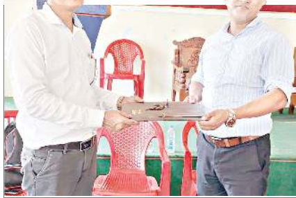
মণিপুর হিল জেনেলিষ্ট ম্যুনিয়ন (এম এচ জে ম্যু) গী নৌনা খল্লা প্রসিডেন্ট হান্নী প্রসিডেন্টনা ম্যুনিয়ন অসিগী থবক খৌরমশিং খুংশিরখিবা