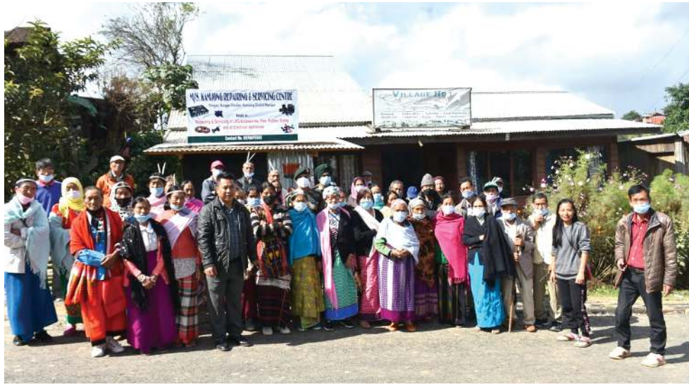
ছাদম বটালিয়ন অসাম রাইফলসনা শিন্দুনা কামজোংদা লেবা হোয়ি হোমস ওল্ড এজ হোমদা ইসেসিয়েল আইমেণ্শিং: অমদি কোভিড ৰিলিফ আইটেমশিং খুংশিৰিবা

এন জি এস এডভাইজৰি বোদকী মেম্বৰ অমসুং মেম্বালাগী ইন্দিয়ন ফোৱেণ্টে সৰ্ভিসকী সিনিয়ৰ ওফিচৰ সী পি মৰাকনা ফোঙদোরকপদা, সন্মিট অসিদা পাণ্ডথোক্লদোৱিবা ফোৱেণ্টে