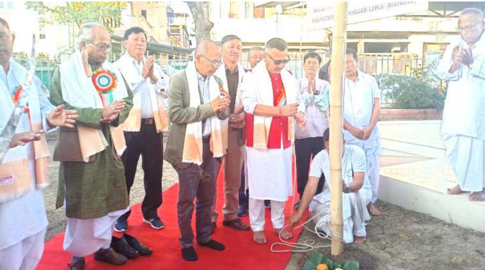
অপুনৰা পোৱমলেন মৰুপ (থাং-তা) মণিপুৰগী ৭১ শুব মপোক কুমওন যৌৱমগা মৰী লৈননা এম এল এল এস কুঞ্জকেশ্বৰনা ফিৱাল চিখংখিবা

মনিৰ সৰকাৰনা ফোঙদোকখিবদা, স্টেট অসিদা বি জে পিগী ওইবা লৈঙাক লাকপদা মতুং নুপী অঙাংদা চখবা ক্ৰাইমগী চাং খঙহেন হেনগংলকখিবনি। মসি গভৰ্ণমেণ্ট অসিগী ওইনদি য়ান্না ইকাইনিঙাইনি। থোকখিবা হৌদোকখিং অসি মতম চানা য়েংশিন্দবা অমদি পায়খংফম থোকপা থবক যৌৱমশিং পায়খন্ডবনা মৰম ওইৱগা ক্ৰাইম ৱেট নোংম-নোংমগী হেনগংলকখিবনি। অদুবু লাইবক থিবদি হৌখিবা নুমিং খৱনি অসিদা স্টেট অসিদা থোকখিবা ৰেপ কেচকী মতুংদা চাফ মিনিষ্টৰনা ৬সি ফাওৱা ৰাফম অমতা ফোঙদোক্তা লৈৱিৰা অসিনি। পুলিসকী মকোক থোংবা ডি জি পিসু হিৱম অসিগী মতুংদা ৰাফম অমতা ফোঙদোক্তা অমদি চেম্ৰিৱশিং ফাদুনা এক্সন লৌখংপসু লৈতে হায়না ময়াল শিৱি।