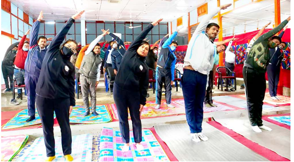
ভাৱত বিকাশ পৰিষদ, ইম্ফাল সাখানা শীপুনা লফ্লেদা লৈবা বি আৰ টি এফকী কেম্পসতা পাঙথোকখিবা নোংমগী ওইবা হেল্ঠ এৱোৱনেন্স প্ৰোগ্ৰামগী শক্তম

অদুৰ মথোয়গী খোঙজংনা মৰম ওইৱস্থা লিকমৰো হাইদ্রো ইলেক্ট্ৰিক পাৱৰ প্লাণ্টকী থবক থোৱমশিংদা চাওনা অকায়বা লাকপদী মীয়ায়লা খুদোংচাদবা কয়া মায়োক্ৰৱিক্সিবা অদুৱী য়েংলগা মতম খৰগী ওইনা খোঙজং অসি সস্পেন্স তৌবনি। হৌখিবা কুমজা ২০০৩ দগী হৌৱগা শামাটৌৱৰু মীয়ায়লা শামাটৌৱৰু দিষ্ট্ৰিক্ট দিমাংদা তৌৱদুনা খোঙজং চণ্ডশিনবা হৌৱকখিবনি। মীয়ায়গী অপান্ধা মতুংইমা লেঙাক্কা থবক তৌফম থোকই হায়ৰি।