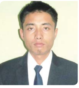
স্পোর্টসকী অশেংবা মশক খরা খাঙবা ওমজরকখি হেমা হোংননিংবগী রাখল অমসু মখতা ফাউরকলে। তশেংনা হায়জরবদা ভোপাল স্পোর্টস একাদেমীনা ঐনী পুসি অসি দিরেঞ্জ চুমা চংহনবীরকখিনি। মরুপ-মপাং তিহা, টিম ইভেন্ট শালবা মতমদা প্লেয়ার ঐখোয় মশেলগী মরজা করি করি রাখলো চেনগদগে হায়বসিসু মনুং খাঙবা ওমজরকখি। একাদেমীনা, নোংমাইজিং খুদিংগী ঐখোয়না লেকচর পীবা লাকখিবা ইন্ডিক্টর ময়ামদু পুসিগী কাউবা ওয়েই। পুসিদা শুকখন খল্লদবা ফজ-ফজবা আইদিয়া ময়াম অমা ওজাশিং অদুনা ঐখোয়না তাকপীরকখি। মদুগী কায়বসু ঐখোয়না য়ালা লেখি।

পুসিগে শোহরকপা, তহুরকপা মীংকুপশিংদসু মীং-না শিংহনবা অদুগুম্‌সু ময়াম অমা য়াওখি। ঐহাদগী নুংগাইজবা অমনা, খুংশু-খুংলায় শুনা রাখল নুংগাইনা নিং-তম্মা প্রেস্টিস তৌবা ফজখিবা অদুনি। ভোপালদা ঐখোয়গী ওইনা স্টেডিং সেন্টরসি মফম অনীদা ফজনা শেমদনা থম্মী। অগ্নর লেক হায়বা অমগা লারর লেক হায়বা অমগা, অনী লৈ। অদুগা ঐখোয়না মরু ওইনা ট্রেনিং তৌবিবা মফমসিদনা অগ্নর লেক হায়বসিদনি। অদুবু ঈশিং ঈরৈ কনখলকপা মতমদি অগ্নর লেক অসিদা প্রেস্টিস তৌবা য়াদে। সিজনগী মতুং ইয়া ঈথং ঈরৈ কনখলকপাদি লারর লেকতা অমুক তৌই। রোয়িংগী ওইনা