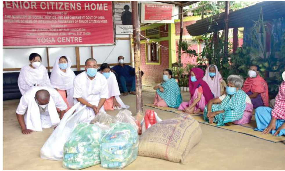
খোঙমন মংজিন জোন-১ দা লৈবা সমুৱাইলাপম দোৱেদ্রো শৰ্মদা মহাক্কী অপোকপী এস এচ ৰাখে লৈখিবৰী সোৱাটকা মৰী লৈননা কোংবা নোংখোঙমন লৈকায়দা লৈবা সেনিয়ৱ সিটিজনস হোমদা চেঙ, হৰাই, খাউ, আলু, চিনি, শপ্লেম, চা মনা, হেদ সেনিটাইজৰ, ফেস মাস্কনাংগিবা পোংলমশিং তেংবাঙখিবা

গুৱাহাটী, জুলাই ০৯ (এজেন্সী): অসামদা হৌখিবা পুং ২৪ দা কোভিড-১৯ গী অনৌবা কেস ২,৪৯৩ খেংনখিবাগা লোয়ননা হায়রিবা মতম অসিদা লায়না লাইচং অসিদা মৱম ওইৱগা মীওই ২৪ শিহনখ্ৰে হায়রি।