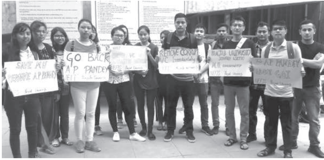
এম যুগী ভি সি পান্দে মফম লৌখোরবা নেফিস চাঙ্গিগর যুনিটনা অৱাং-নোংপোক লমদমগী মহৈরোয়শিগা খুংশম্মদনা পঞ্জাব যুনিটসিটিনা খোঙজং চঙশিনবা

টোপাংমহা/অহিং তুয়া যাদবা, খোঙয়া শাবা, কৱিগুয়া অমা চাশিনবা মতমদা খোনাওদা থনগংলগা লৈবগুম তোঁবা, য়েংকী খোঙ অমদি খুং শিথবগুম তোঁবা, তাং তাং চিকপা, চাকখাউ শোকপা, থবাক নাবা, পুজা গ্যোঞ্জিক কারণ পুক নুংঙাইতবা অমদি পুক কংখংপা ফহনবা ওজা জিয়া উল হগপু খাগংচরি