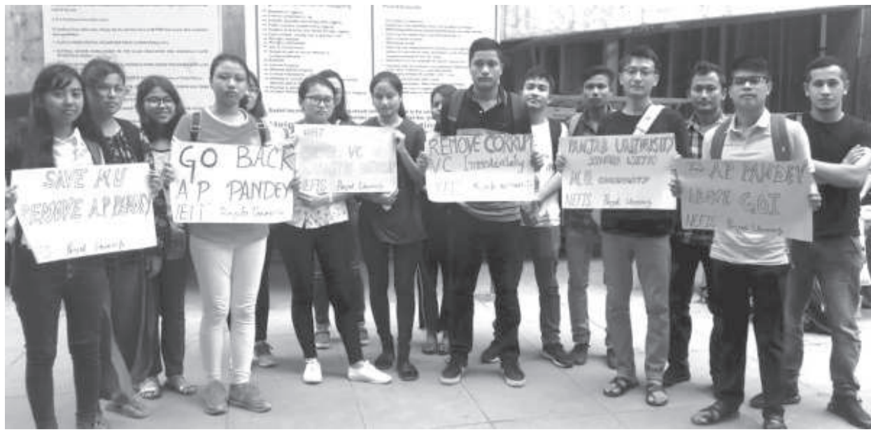
এম যুগী ভি সি পান্দে মফম লৌখোরবা নেফিস চাঙ্গিগর য়ুনিটনা অৱাং-নোংপোক লমদমগী মহৈরোয়শিগা খুংশম্মদনা পঞ্জাব য়ুনিটসিটিনা খোঙজং চঙশিনবা

টোপাংমচং/অহিং তুয়া যাদবা, খোঙয়া শাবা, কৱিগুয়া অমা চাশিনবা মতমদা খোনাওদা থনগংলগা লৈবগুম তোঁবা, য়েংকী খোঙ অমদি খুং শিথবগুম তোঁবা, তাং তাং চিকপা, চাকখাউ শোকপা, থবাক নাবা, পুজা গ্যোঞ্জিক কারণা পুক নুংঙাইতবা অমদি পুক কংখংপা ফহনবা ওজা জিয়া উল হগপু খাগংচরি