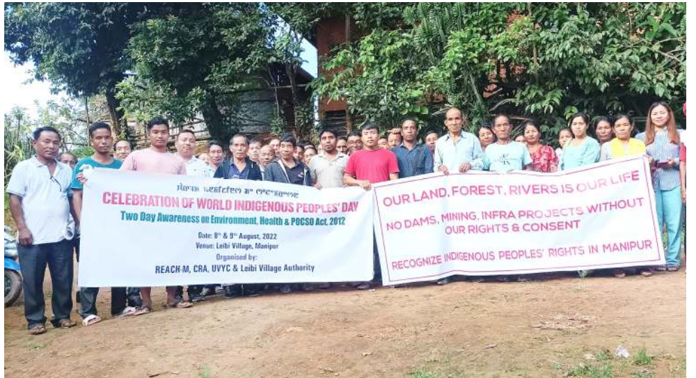
সেন্টর ফোর রিসার্চ এন্ড এডভোকেসি মণিপুর অমসুং লেবি ভিলেজ ওখোরিটি খুংশুম্ন লেবি ভিলেজনা পাঙথোকখিবা বার্লট ইন্ডিজিনাস পিপলস দেগী থৌরম

য়ু পি এ লৈঙাক্সা লৈরিঙে মতমদা গ্যাস সিলিন্দরগী মমল লুপা ৪০০ লীবা মতমদা পোং চৈগী মমল কাং হেন্না তাংলে হায়দুনা হৌজিক এন দি এ লৈঙাক্সা যুনিয়ন মিনিষ্টর ওইনা লৈরিবা শ্টিউটি ইরানিনা লুচিংদুনা খোঙজং কয়া চঙশিনখি। অদুবু মহাক্সী পাটিয়া পরার পায়রুকা মতম অসিদা গ্যাস সিলিন্দরগী মমল লুপা ১৩০০ হেন্নে। অদুবু মহাক্সী করিমজা খঙশিদাবা শাদুনা লৈরি। মসিনা তাকপদি বি জে পিনা য়াওঁবিশিং অসি মশাগী ওইজবা খরা ফনবগীদমক মরাল লৈজব্রবা মীওই কয়গী থরায় অরেশ্বনা মাঙহনবা ওইনা ভাঙনি হায়বসি হৌজিক ময়ক শেংলে। মরম অদুনা অসিগুয়া পাটি অমদি লৈঙাক অসিবু মীয়ামা পারা তল্লিবগী মতম ওইরে হায়না মখা তানা ফোঙদোকখি হায়রি।