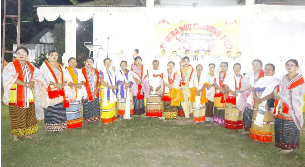
কোংবা য়ুম গৰ্ণাইজেনসনা শিন্দুনা কোংবা নোংথোম্ম লৈকাৱদা লৈবা গৰ্ণাইজেনস অসিগী শঙলেন্দা পাঙথোকখিবা অহানবা মেৱা হৌ চোংবগী খৌৱমদা শৰুক য়াখিবাং

গভৰ্ণমেণ্টকী অয়াবা য়াওদনা ম্যাম্মাৱ নেসনলশিং স্টেট অসিদা লম লৈবা নংৱ্ৰগা কৰিগুন্না মখল অমন্ত্ৰগী বুজিনেস তৌদনবা অকনবা ৰাফম থমন্ত্ৰে হায়রি। অমৰোমদা স্টেট অসিদা ইল্লিগেল ওইবা বুজিনেস কয়া চখৱক্লিবা অসিদা পুলিসনা অহেনবা মীওংয়েং চঙদুনা পায়খৎলকপা ওপৱেসনশিংদা ম্যাম্মাৱ নেসনল কয়া য়াওৱক্লিগা লোয়ননা ফগৎলক্। ওইৱক্লিবা ফিভম অসি অথুবা মতমদা কন্ট্ৰোল তৌনবগীদমক মিজোরাম গভৰ্ণমেণ্ট অমদি অসাম ৱাইফলসকী মকোক থোংবা ওফিসলশিংগা ৱাৰী শায়দনা পায়খৎপা য়াৰা চেকশিন থৌৱাংশিং পায়খৎপা হৌনবা খঙহনন্ত্ৰে। অমদি স্টেট এন জি ওশিংনসু হিৱম অসিদা লৈঙক্লি মতেং পাংনবা অপিল তৌৱক্লি।