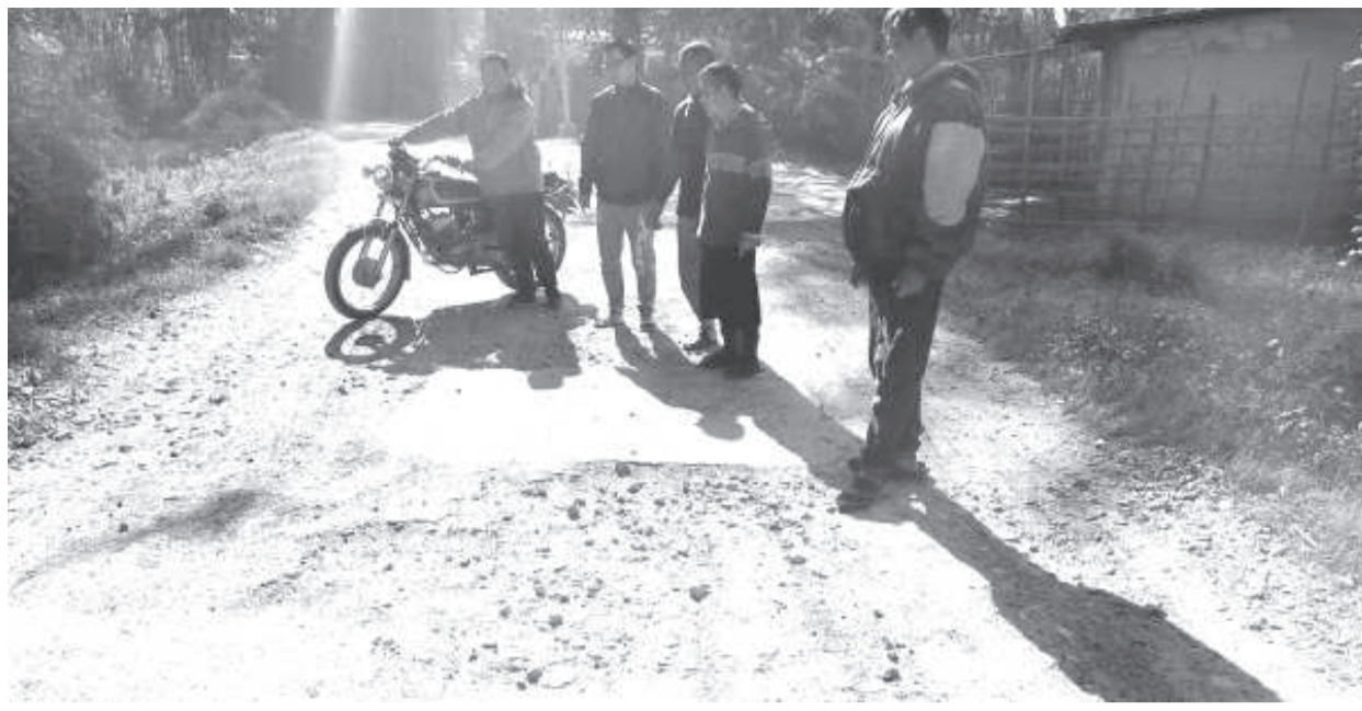
শেমজিনবিদবদগী কা হেমা ফিমত শোঙ্কবা রাংজিং তেহ্না এ সীগী কিলোমিটার ২.৫ ৱেমা শাংবা খোঙজোম সাপম ইন্টর ভিলেজ রোদকী শক্তম