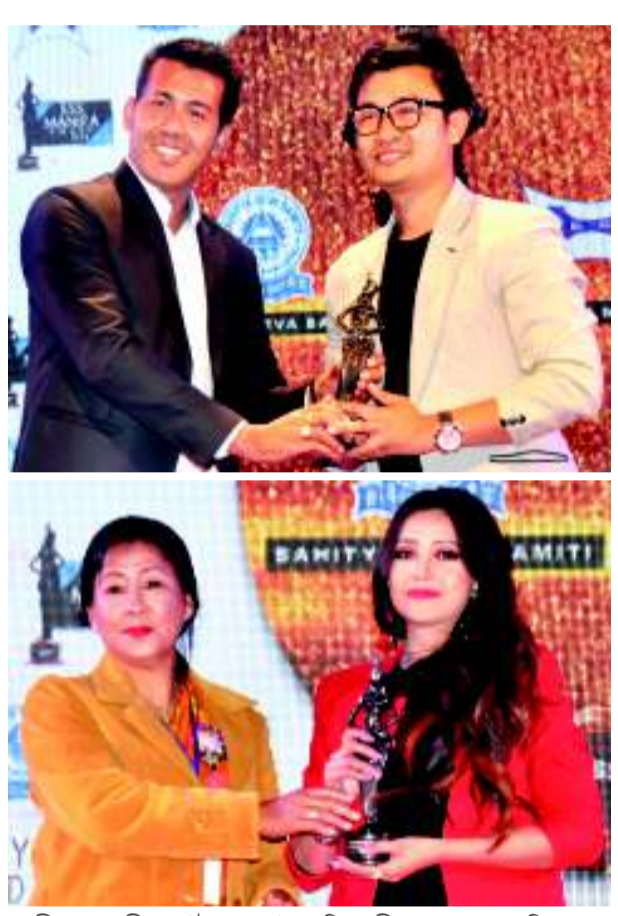
ককচাঁং, ফেব্রুৱারী ১০ (এচএনএস): সাহিত্য সেবা সমিটি, মণিপুরনা ফিল্ম ফোরাম মণিপুরগী খুংশিম্নদুনা