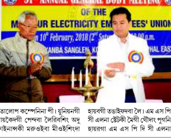
তোলোপ কেম্পনিদা পী। য়ুনিয়নগী মায়কেন্দগী পেপদা লৈরিবিশিং অদু ফাইনালকী মরুওইবা মীওইশিংদা