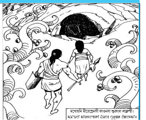
মোটে এন্ড কোপু (অনাল ফোক টেল) ম্হুংগাং ঞাংগুং ঞাংগাং (য়েটেব হুয়াং ঞাংব) হৌৱি অমসুং আৰ্ট : সামন সলাম