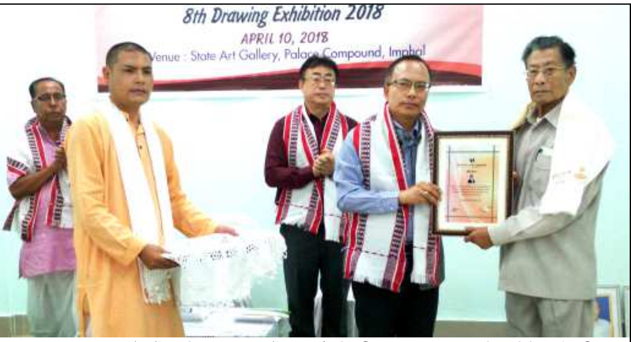
পেলেস কম্পাউন্ড লৈবা স্টেট আৰ্ট গেলারিডা পাণ্ডথোকপা আৰ্টস সোসাইটি মণিপুরী মপোক কুমওন অমসুং দ্রোয়িং এগজিভিচন যৌৱমগী শত্ৰু