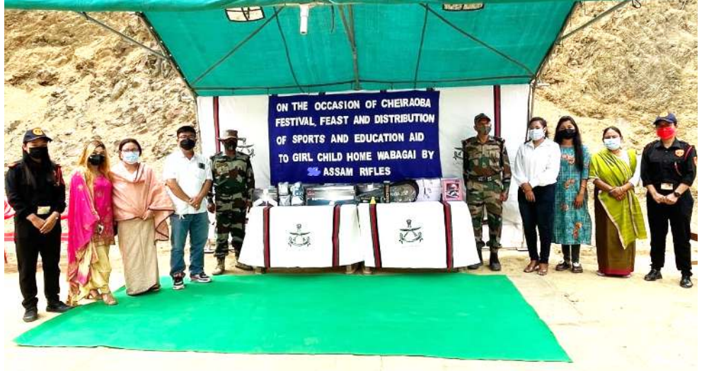
ফুট্রে বটালিয়ন অসাম রাইফল্সনা ৱাৰগাইদা লৈবাগল চাইল্ড হোমদা চেৱাওবা কুইক্সো মরী লৈননা স্পোর্টস অমসুং এডুকেশ্যনল এইডশিং য়েছোকখিবা

মহাক্সা মখা তানা ফোডলেকখিবদি পোং চৈগী মমল খরা তাংখংলৈবাক অসিদি কোভিড-১৯ না মরম ওইরগনি। অদুৱ অসাম স্টেটকী ওইনদি অতোপা প্রসাদনা অসাম স্টেটত পোং চৈগী মমল য়ালা হোংখি। অমরোমদা পোং চৈ মমল তাংখংলৈ হায়না লাউরিবশিং অদু কালিটি মেটেন তৌদবা পোংলমশিং চাবা পাস্বা মীওই ভাজনি হায়ত্রে।