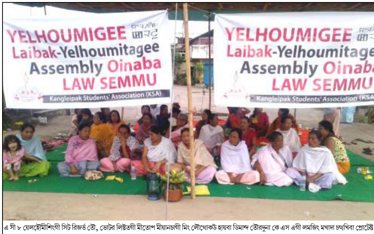
এসী ৮ য়েলহৌমিগী সীট রিজর্ভ তৌ, ভৌটর লিষ্টতৌ মীতোপ মীয়ানচী মিং লৌথোকউ হায়বা ডিমাদ তৌরনু কে এস এগী লমজি মখাদা চখাখিবা প্রোটেট