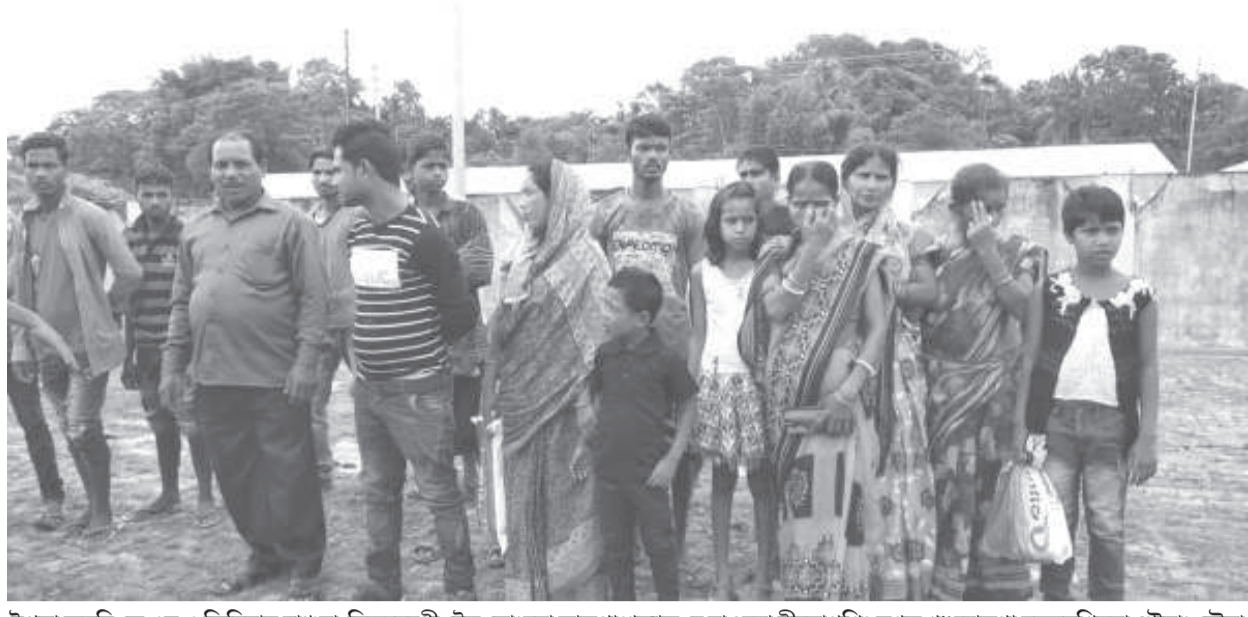
ইপসা অমদি কে এস এ জিবিবাম ব্রাহ্মণা সিলচরদী ট্ৰেল ভেংদনা লাকপা শজক চেয়াওদবা মীতোপশিং মশক খঙদোকপা হলাহনখিনবা থৌরাং ভেঁবা

ট্ৰাফিক/অমাঙথোং ময়াদা মচা অমা পোমথোকপা লৈবা, খোঙ হাঙ্গা চাং নাইদবা, অমাঙথোংগী অকোয়বদা য়ান্না হাঙ্কচবা, খোঙ হাঙ্গা খুদিংগী ঈ দ্রোপ দ্রোপ তারকপা, পুজা গ্যেট্ৰিক কারগা য়ারোমদা ভেঁয়না ভেঁয়না খেগংপা ফহনবগী ওজা জিয়া উল হগপু খাগচরি